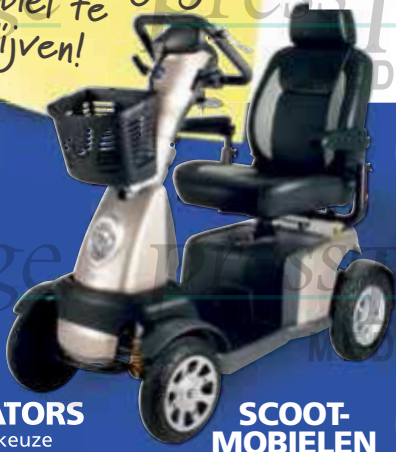
SCOOT-MOBIELEN (nieuw en gebruikt)

Cartografenweg 28A | 5141 MT Waalwijk Tel. 0416 560 160 | Email info@mobiliteitopmaat.nl | www.mobiliteitopmaat.nl