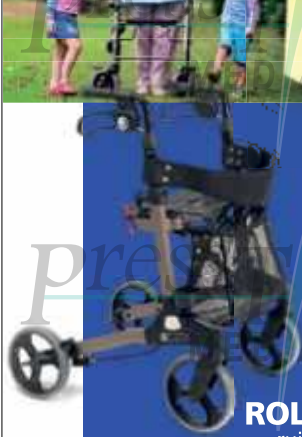
ROLLATORS ruime keuze